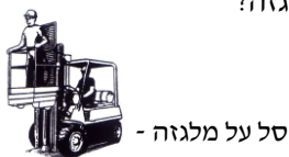
סל על מלגזה -

8. האם נדרשים עובדי המחלקה לרדת אל בורות בעומק 2 מטרים לפחות? כן / לא (הקף בעיגול)