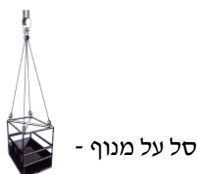
סל על מנוף -

7. האם נעשה שימוש בסלים להרמת אדם ע"ג מנוף או מלגזה? כן / לא (הקף בעיגול)